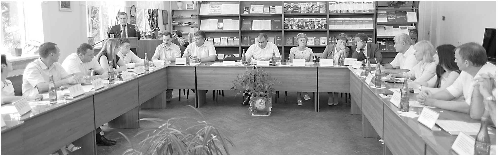
Участники круглого стола «Проблемные вопросы применения примирительных процедур (медиации) в гражданском и арбитражном процессе».

Представители органов государственной власти, практикующие юристы и ученые обсудили перспективы развития института медиации в Адыгее